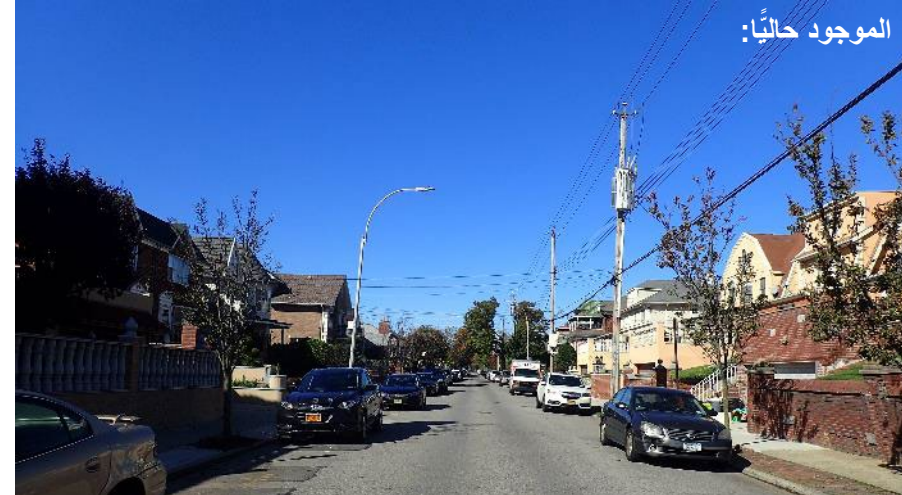
الشارع رقم 85