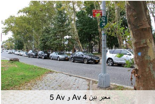
معبر بين Av 4 و Av 5

ستبحث وزارة النقل في التحسينات المحتملة على معابر مسار Leif Erikson وستعمل مع إدارة الحدائق لتحسين الظروف.