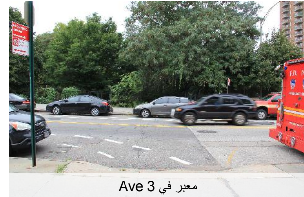
معبر في Ave 3