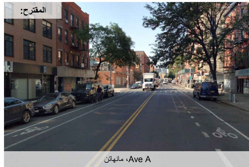
Ave A، مانهاتن

تثبيت الممرات المخصصة للدراجات • يوفر مساحة مخصصة لراكبي الدراجات