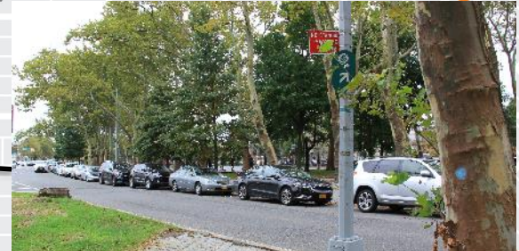
متنزه Leif Ericson