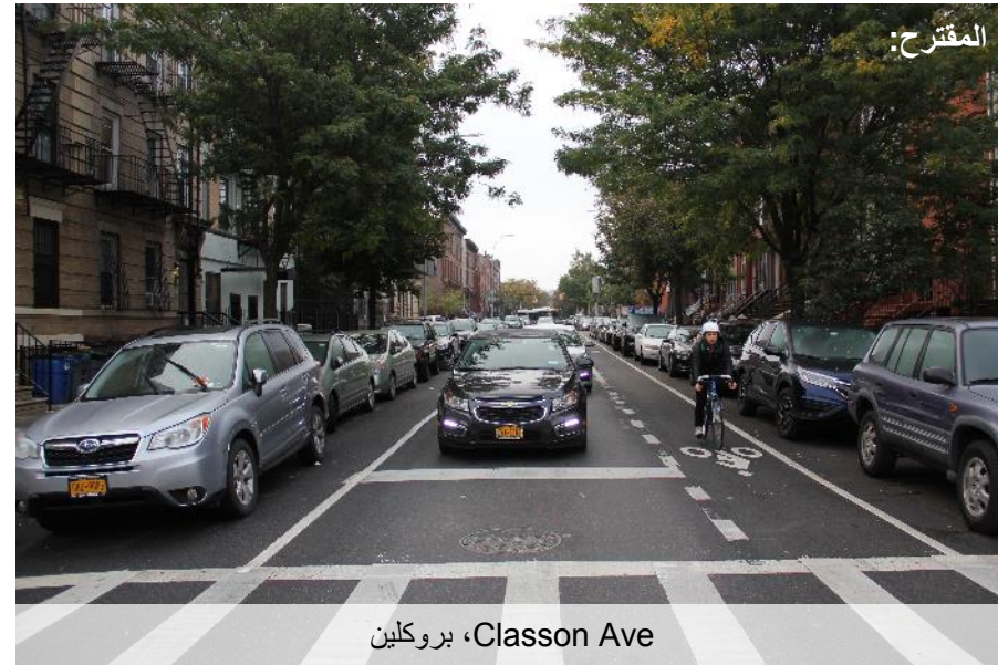
بروكلين، Classon Ave