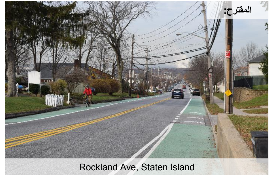
Rockland Ave, Staten Island