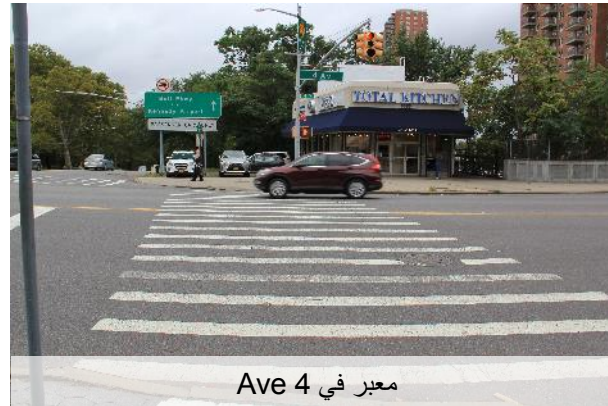
معبر في Ave 4