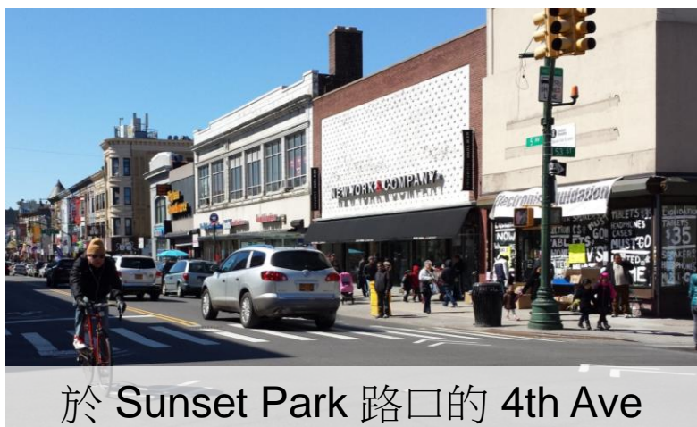
於 Sunset Park 路口的 4th Ave