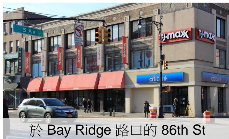
於 Bay Ridge 路口的 86th St